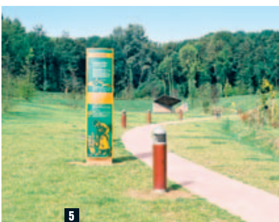
EMMANUEL GAFFARD/URBAINE DE TRAVAUX