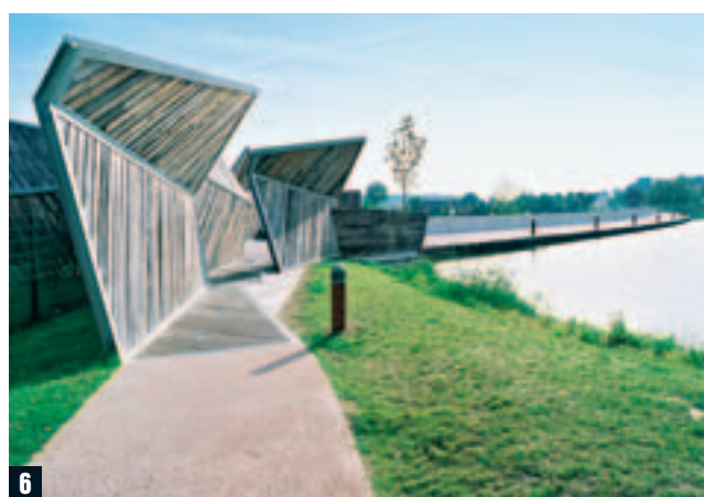
EMMANUEL GAFFARD/URBAINE DE TRAVAUX